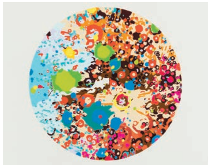
The south side of the moon , 2016 sérigraphie en 20 couleurs, 30 exemplaires sérigraphié par Mélanie Leduc, atelier Les Michellines

Ces différents chemins, c'est un peu le journal de l'artiste, un voyage permanent dans un gigantesque mall rempli de signes clignotants. Un monde réduit à ce qu'il annonce en grand. De croquis en croquis, on finira par diriger la lorgnette sur Lune, et sur sa face cachée — très belle, si découverte. On y retrouvera nos logos tachetés en version camouflage — pas si différents de nos globes oculaires remplis de phosphènes, nos petites enseignes lumineuses intérieures privées. C'est encore une histoire de marques. On découvrira la chose par étapes chromatiques dans le livre The South Side of the Moon . Un astronaute en a décrit la vue : L'autre face ressemble à un tas de sable avec lequel mes enfants ont joué autrefois. Tout est comme détruit, il n'y a pas de mots pour la décrire, juste beaucoup de bosses et de trous.