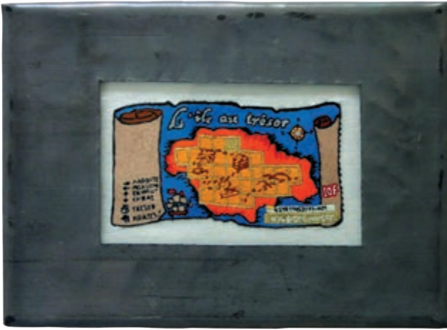
L'île au trésor , 2005 - série Nuls si découverts - broderie et plomb - 22,5 x 16,5 cm