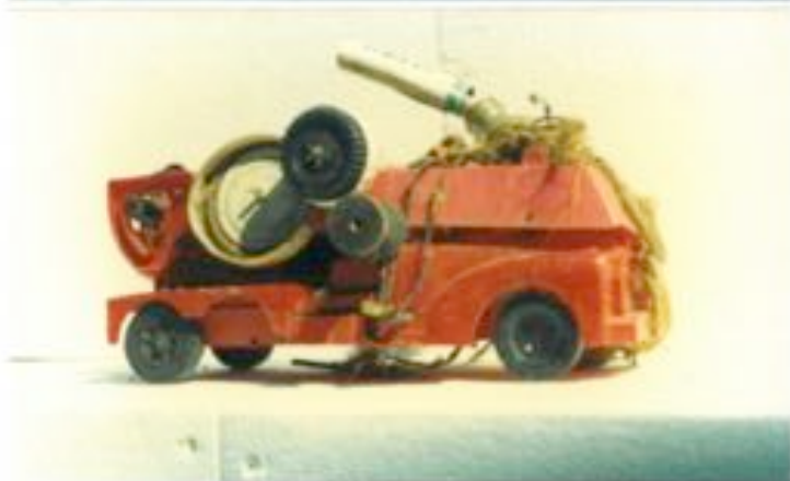
Les créations/jouets de Jean Bordes.