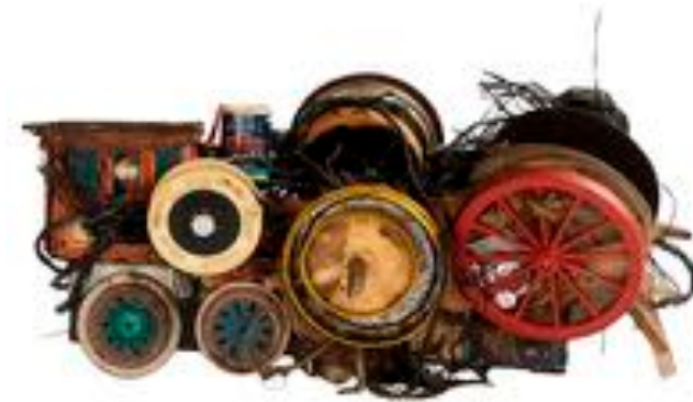
ENGIN Matériaux de récupérations. 19x40 cm