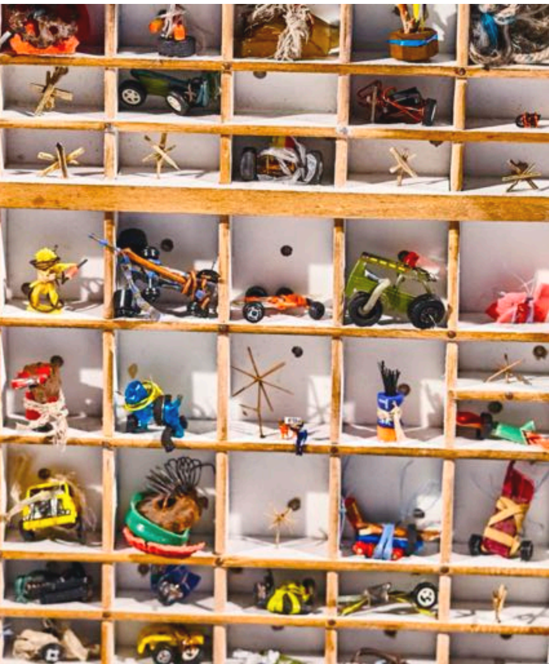
Détail d'un théâtre miniature