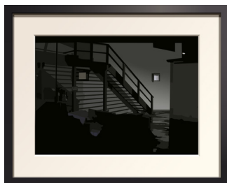
An American Landscape - Passing the backs of buildings, 2021 © Alain Bublex - Courtesy Galerie GP & N Vallois, Paris