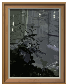
An American Landscape - Who's shooting there, who's shooting there, who's shooting there, 2021 © Alain Bublex - Courtesy Galerie GP & N Vallois, Paris