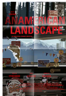
An American Landscape (an industrial enameled musical), 2021 © Alain Bublex - Courtesy Galerie GP & N Vallois, Paris