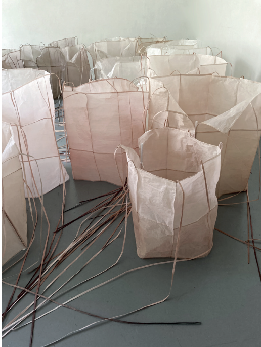
Silence fragile