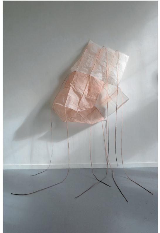
Silence fragile