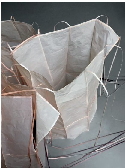
Silence fragile