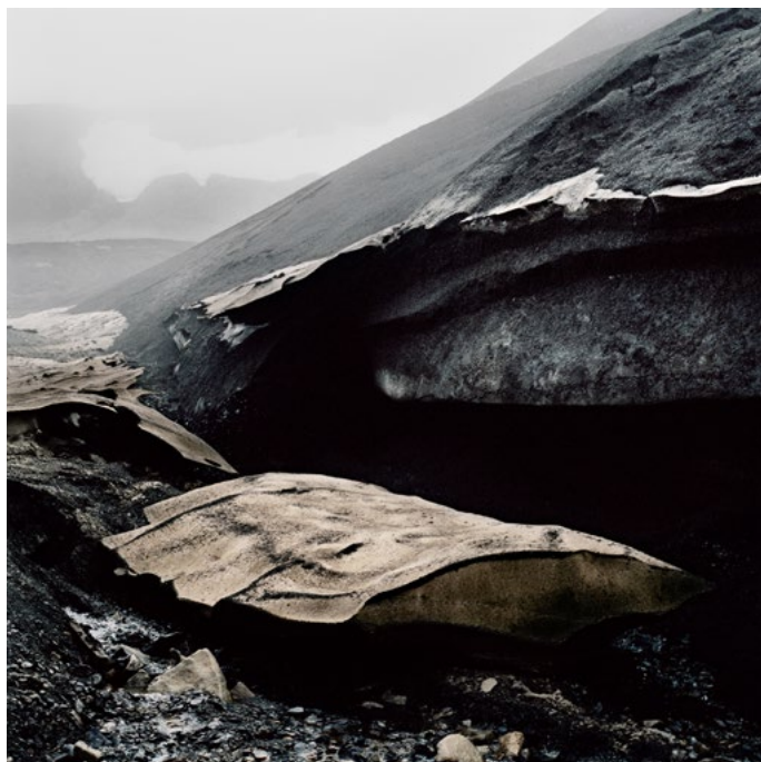
Moraine et névé, vallée de Gilsongryta, 2005-2006