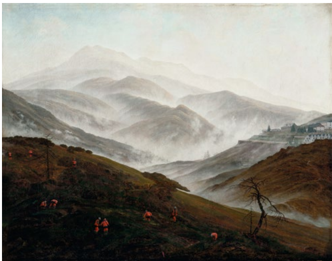
Brume sur le Riesengebirge I, 1820-2017