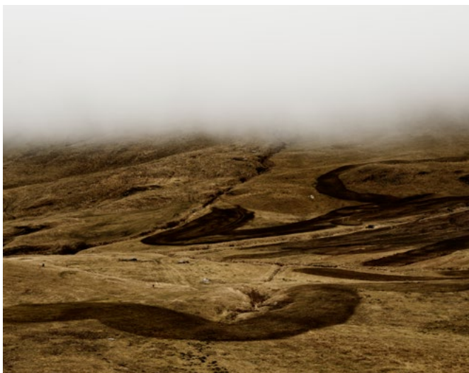
Fumier sur les pistes de Val Cenis, 2014-2017

Cette série de photographies a été produite avec le concours financier de la Région Nouvelle-Aquitaine (2015)