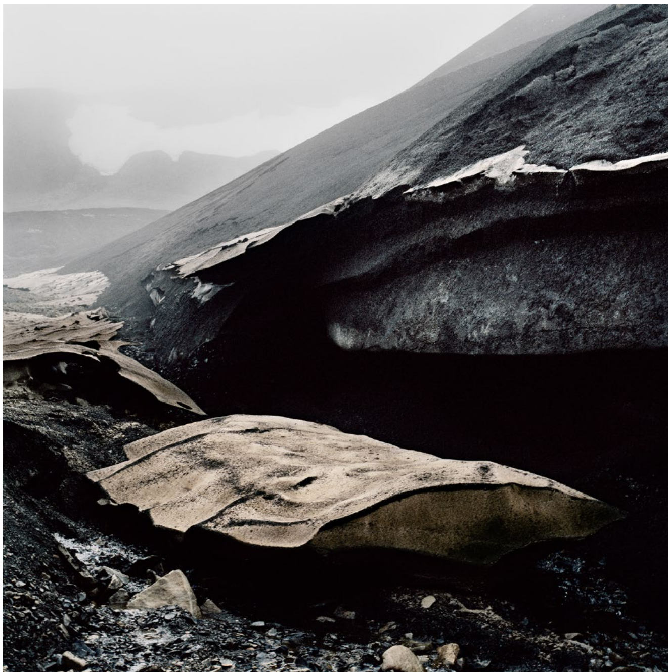
Moraine et névé, vallée de Gilsongryta, 2005-2006