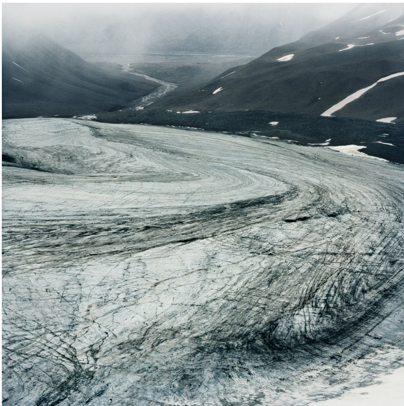
Glacier de Fleinisen, 2005-2006