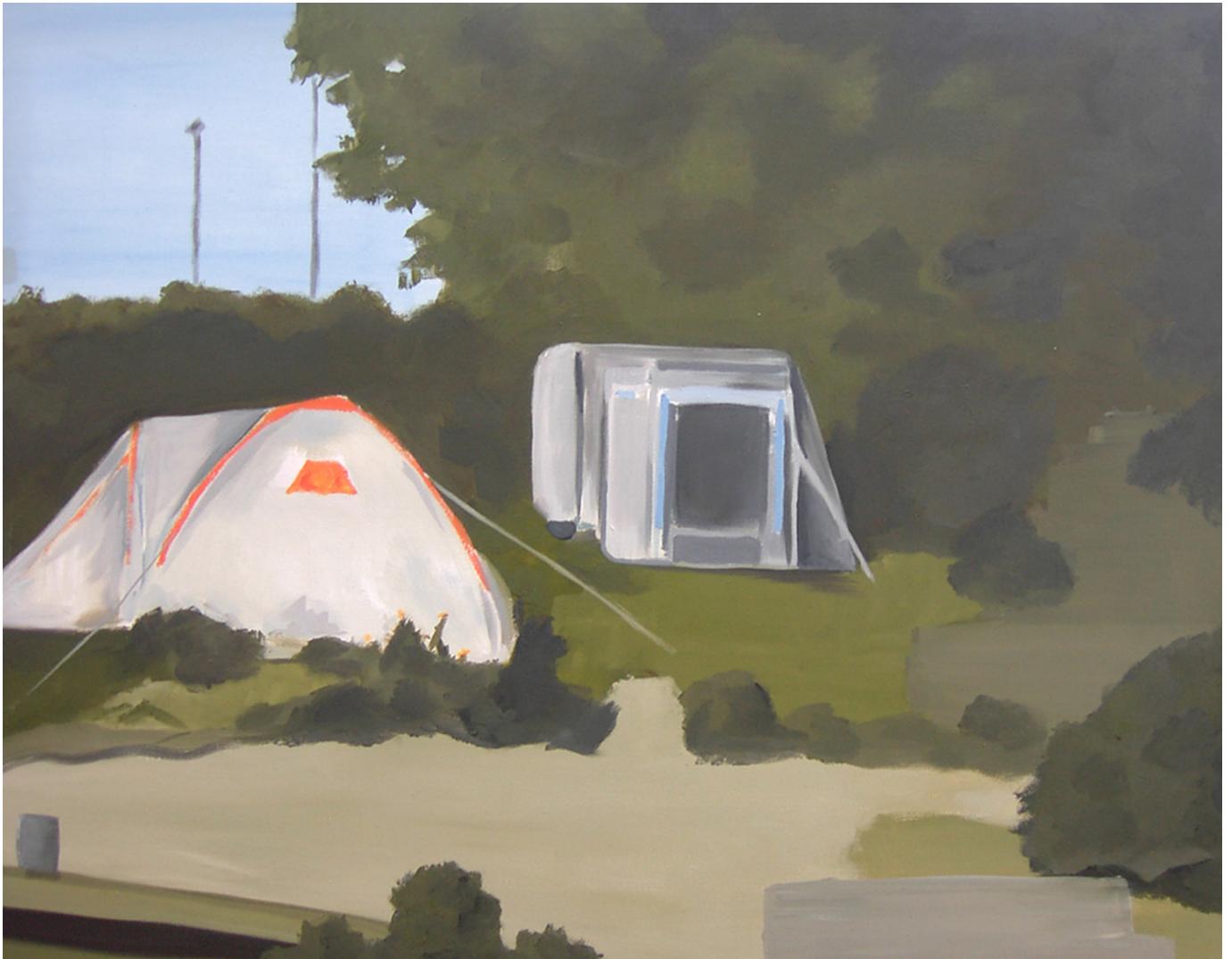
Camping - huile sur toile - 70 x 90 cm - 2006

Tiré à part de l'Agence culturelle départementale Dordogne-Périgord printemps 2021