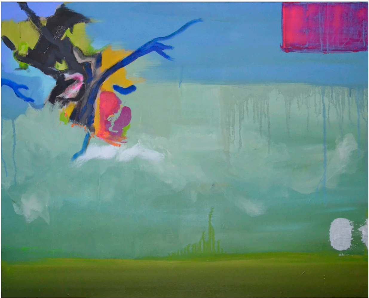
Valeurs inversées / Chocs - huile sur toile - 80 x 100 cm - 2018

Né en 1975, Florent Contin-Roux vit et travaille à Limoges et Saint-Victurnien.