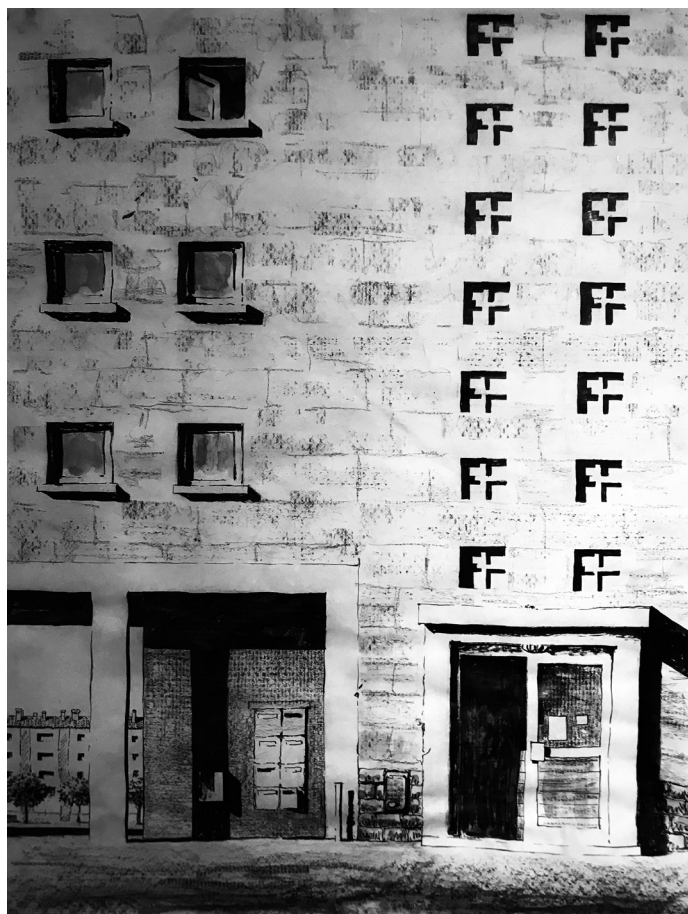
Extrait de la série Façades © Troubs - 2017

Quelques mois plus tard, c'est une fresque monumentale qu'il dévoile au public, toujours visible aujourd'hui, et qui témoigne du temps passé dans la cité et de la rencontre avec ses habitants.