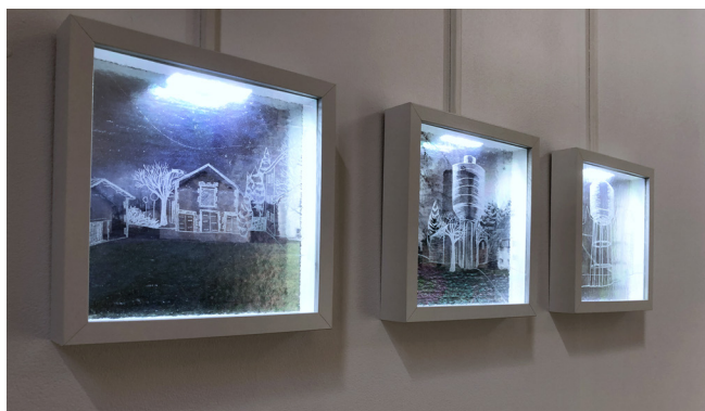
Série Perceptions (extraits) © Mathilde Caylou - 2018