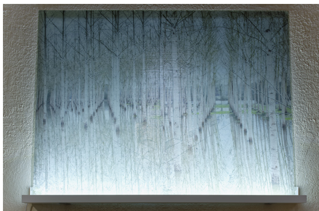
Flottements © Mathilde Caylou

En automne 2018, l'exposition « Flottements » a réuni les créations de verre de Mathilde Caylou qui portent l'empreinte de son séjour à Vauclaire.