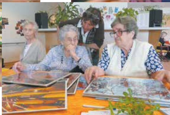
Atelier à l'EHPAD de Castel/Saint-Cyprien