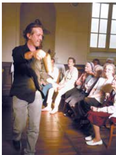
Animation d'ateliers dans le cadre de la résidence de la compagnie LagunArte en septembre 2014 à l'Hôpital d'Excideuil

C'est un temps fort pour tous, avec des rires et des larmes d'émotion. Nous préparons déjà le projet suivant. S'il est accepté, il sera présenté au personnel et une équipe de pilotage se constituera en interne. Cela amène de la vie, une ouverture sur l'extérieur, et modifie le regard sur les EHPAD : on y est vivant jusqu'au bout !