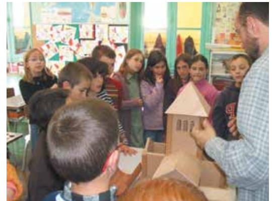
Animation d'un atelier sur les églises romanes avec des élèves d'école primaire

"Ma mission consiste principalement à transmettre, valoriser, ou révéler l'extraordinaire richesse du patrimoine de ce département autant que le travail de ceux qui l'étudient"