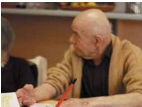
Atelier à l'EHPAD de Castel/Saint-Cyprien