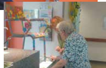
Oeuvre collective à l'EHPAD de Lanouaille

En élargissant le cadre du dispositif national Culture et Santé, le Département a initié un projet pilote afin de favoriser la mise en place de projets culturels au sein des EHPAD (Établissement d'hébergement pour personnes âgées dépendantes) et foyers de personnes handicapées.