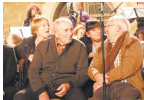
Concert à l'Hôpital d'Excideuil avec la compagnie LagunArte, les résidents et le personnel de l'établissement

Cette politique publique, mise en place au niveau national et relayée en région, est fondée sur la prise en compte de populations fragilisées, immobilisées, privées temporairement de liens avec la vie culturelle. Parce que la culture, sous toutes ses formes d'expression, a un rôle à jouer pour maintenir ces liens et contribuer à l'épanouissement individuel et collectif, l'Agence culturelle départementale s'attache à mettre en relation les équipes artistiques qu'elle soutient avec les établissements de santé qui souhaitent faire entrer l'art et la culture dans leurs murs. Les ressources des uns et des autres sont ainsi mobilisées, au profit de tous et notamment des résidents de ces structures.