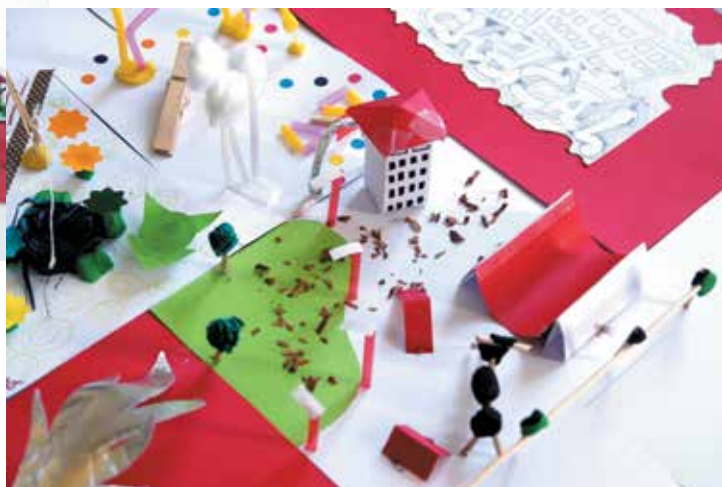
Créations des détenus suite à la visite de l'exposition d'Alain Josseau en novembre 2014 à l'Espace culturel François Mitterrand à Périgueux