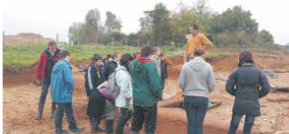
Visite du chantier de fouilles à Mussidan animée par le service départemental de l'archéologie