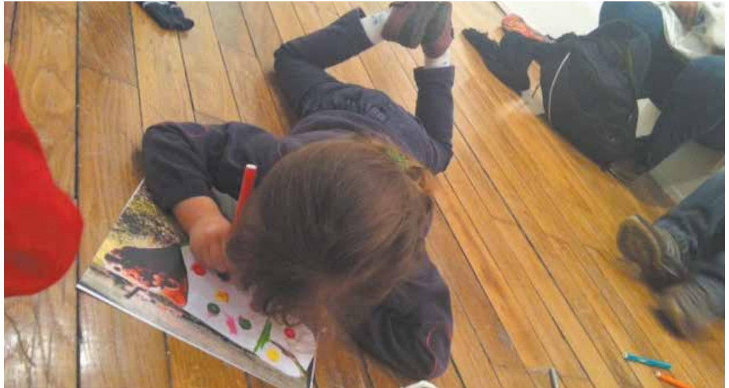
Atelier dans le cadre de l'exposition "Optiques limousines" de Pierre Malphettes - octobre 2013